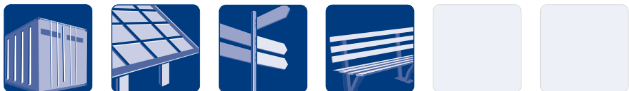
KSF M 140x 2100-M24