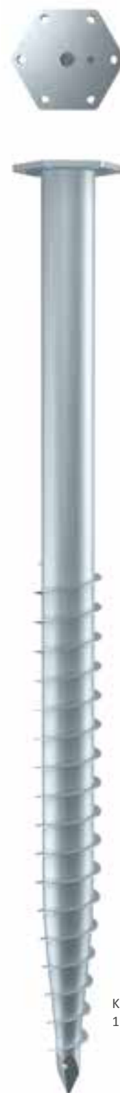
KSF M 89x 1600-M24